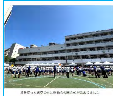
澄み切った青空のもと運動会の開会式が始まりました

協力員は、立候補制になって初めて の大きな行事です。立候補制になっ てから、都合に応じて参加しやすい、募 集ページや説明などが分かりやすいと 好評でした。行事によっては、すぐに 定員一杯になってしまうものもあつたそうです！