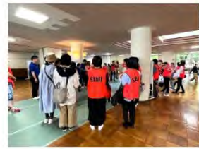
当日のミーティングの様子

令和5年5月21日の日曜日、待ちに待った運動会が開催されました！ 前日は雨天のため残念ながら延期になってしまいましたが、翌日は打って変わ って晴れ渡り、絶好の運動会日和となりました。