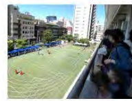
保護者はベランダの観覧席で応援！

ベランダからの観覧席からは、「お兄ちゃん、いた！」「がんばれー！」などなど、応援の声があがります。 空いている観覧席への誘導など、臨機応変な対応をされるPTAの皆さん。そのおかげで、ベランダの観客席は密にならず、安全でスムーズな 観戦が出来ました。