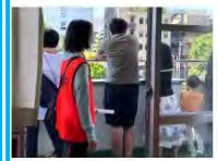
協力員の誘導のおかげです